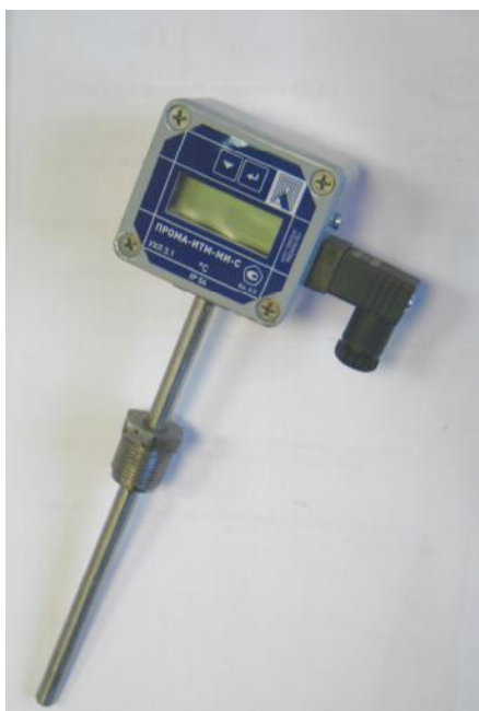
Фото 4. Фотография общего вида измерителя ПРОМА-ИТМ-МИ-С.