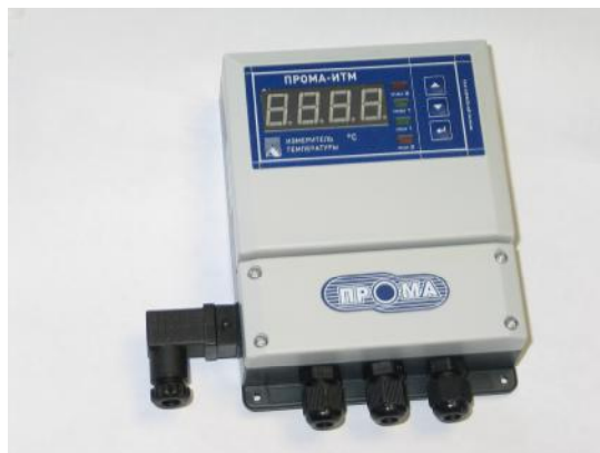
Фото 2. Фотография общего вида измерителя настенного исполнения ПРОМА-ИТМ-Н.