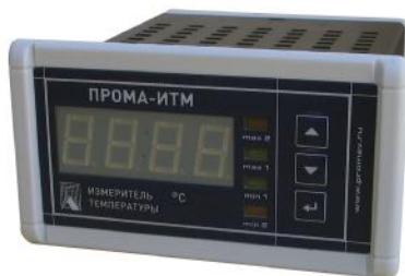
Фото 1. Фотография общего вида измерителя щитового исполнения ПРОМА-ИТМ-Щ.

Фотографии общего вида измерителей приведены на фото 1,2,3,4.