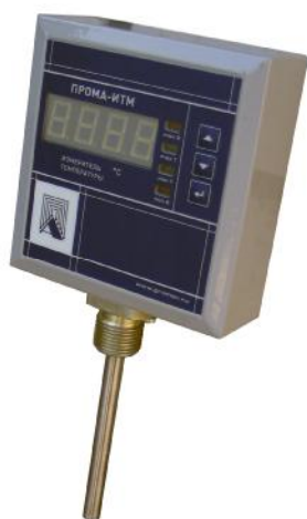
Фото 3. Фотография общего вида измерителя для установки на трубопровод ПРОМА-ИТМ-Р.